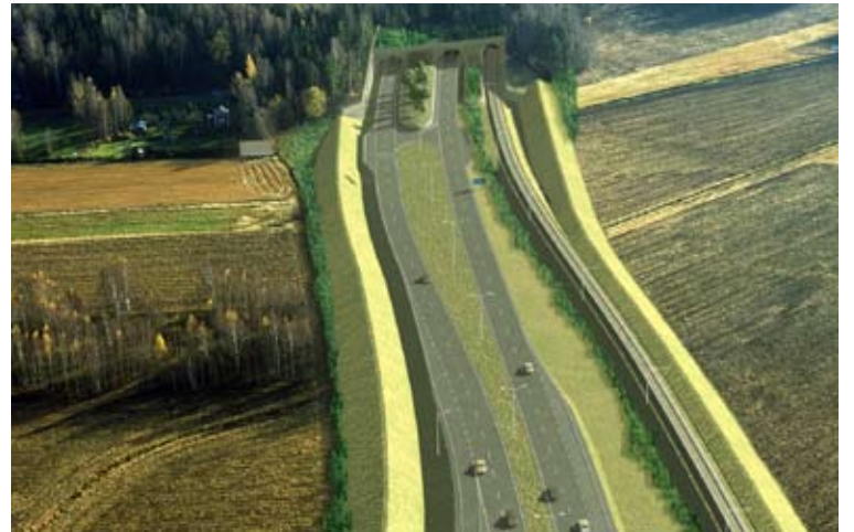
Bullervallar byggs på vardera sidan om trafikkorridoren.

Den största entreprenadhelheten i hamnprojektet är schaktningen av Savio järnvägstunnel. Tunneln är 13,5 kilometer lång och går ställvis ner på upp till 60 meters djup. En vibrationsisoleringsmatta under rälsen skall dämpa vibrationerna och stömljudet från tågtrafiken.