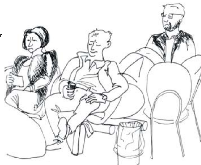
Udnyt ventetiden; En tænkepause eller tid til networking (Teckning: Ditte Kilsgaard Møller)

Hvad er spændende med den her processen er at man går fra gruppe til gruppe således at både man selv og idéerne roterer. Dynamikken kan derfor blive endnu kraftigere.