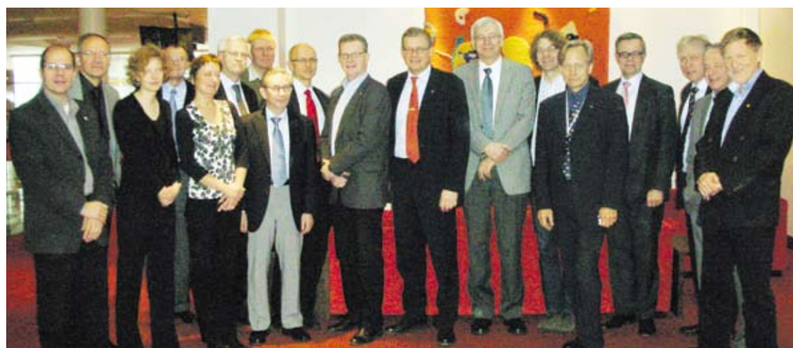
Förbundsstyrelsen samlades till kongressperiodens sista möte i Helsingfors i mars.