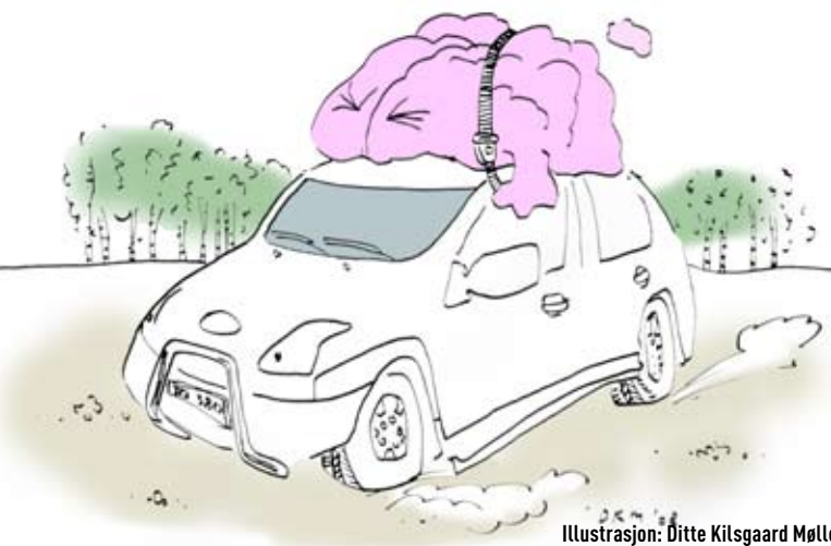
Illustrasjon: Ditte Kilsgaard Møller

- After all the sensing systems cannot match the human performance.