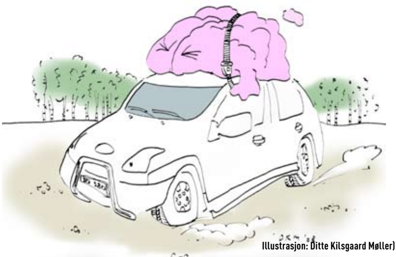
Illustrasjon: Ditte Kilsgaard Møller

- After all the sensing systems cannot match the human performance.